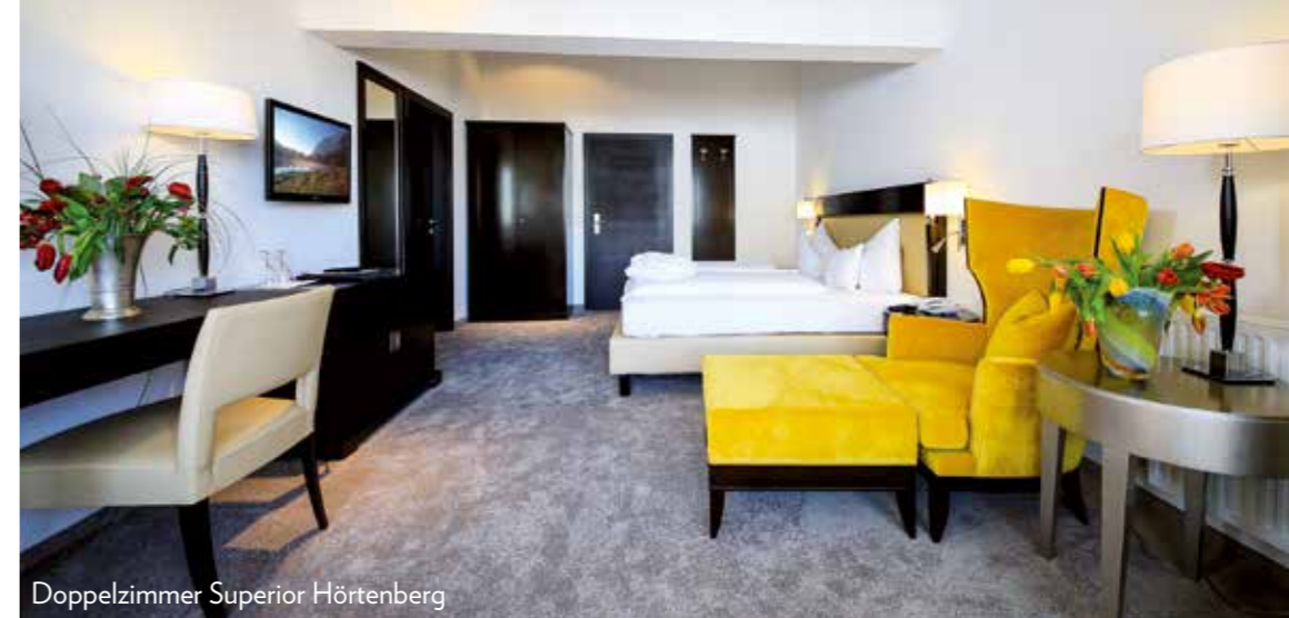
Doppelzimmer Superior Hörtenberg

Our variety of room categories offer something for any taste. We pay great importance to your individual needs.